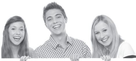
Калуга, пер. Те